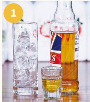
1. 유리잔에 얼음을 2/3 ~ 3/4정도 채운다. * 사용하는 얼음 사이드가 불수축 탄산이 좀 더 오래 유지될 수 있다.