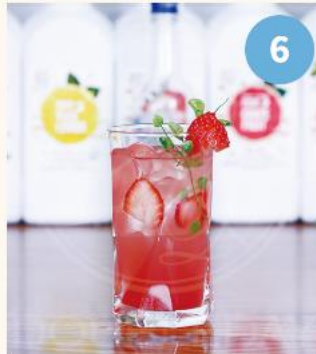
6. 어울리는 과일 슬라이스 또는 애플 민트 등으로 데코레이션해도 좋다.