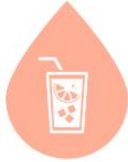
과일 에이드/소다 FRUIT ADE/SODA (14oz)