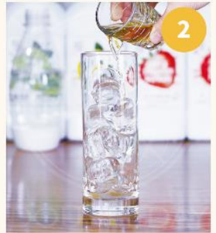
2. 위스키 25~30ML를 '1'의 잔에 부어준다.