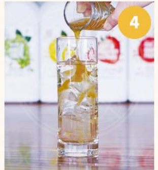
4. 퓨럽 25~30ML를 '3'의 잔에 부어준다.