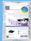
블루 패션 요거트 (블루베리)