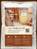
메이플 초콜릿 라떼