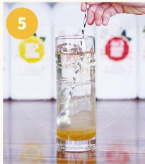
5. 탄산이 최대한 깨지지 않도록 퓨럽이 섞일 정도로만 저어준다.