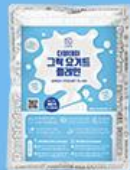
그릭 요거트 플레인