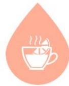
과일 차 FRUIT TEA (10oz)