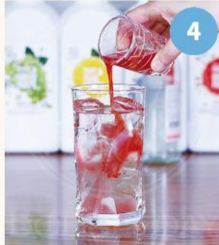
4. 퓨럽 20~30ML를 '3'의 잔에 부어준다.