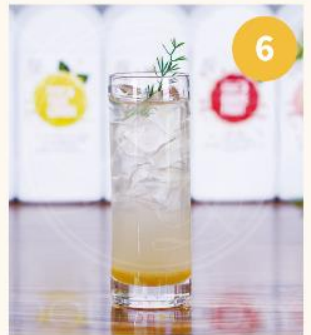
6. 어울리는 과일 슬라이스 또는 애플 민트 등으로 데코레이션해도 좋다.