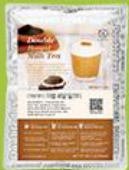
더블 로얄 밀크티 (홍차 라떼)