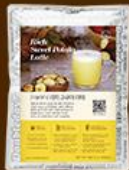
리치 고구마 라떼