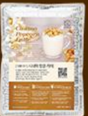
사이다 맑은 라떼