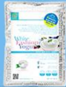
화이트 패션 요거트 (블루베리)