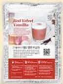
레드 벨벳 바닐라