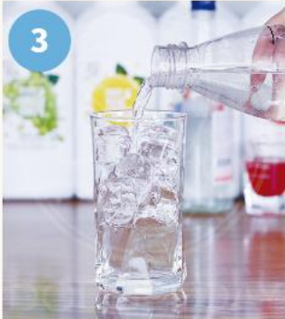
3. 탄산수 150~200ML를 '2'의 잔에 부어준다.