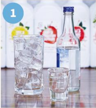
1. 유리잔에 얼음을 2/3 ~ 3/4정도 채운다. * 사용하는 얼음 사이드가 불수축 탄산이 좀 더 오래 유지될 수 있다.