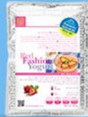
레드 패션 요거트 (딸기)