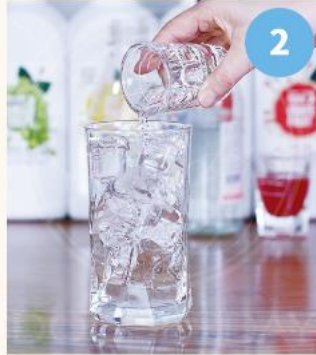
2. 증류주(소주) 50~60ML를 '1'의 잔에 부어준다.