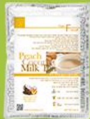
피치 코코넛 밀크티 (홍차 라떼)