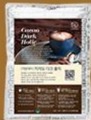
카카오 다크 초콜릿