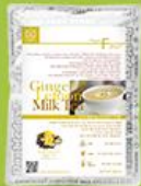
진저 레몬 밀크티 (홍차 라떼)