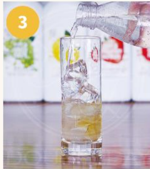
3. 탄산수 150~200ML를 '2'의 잔에 부어준다.