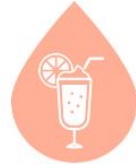
과일 슬러쉬 FRUIT SLUSH (14oz)