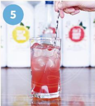
5. 탄산이 최대한 깨지지 않도록 퓨럽이 섞일 정도로만 저어준다.